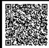
どうなん・追分シーニックバイウェイルート