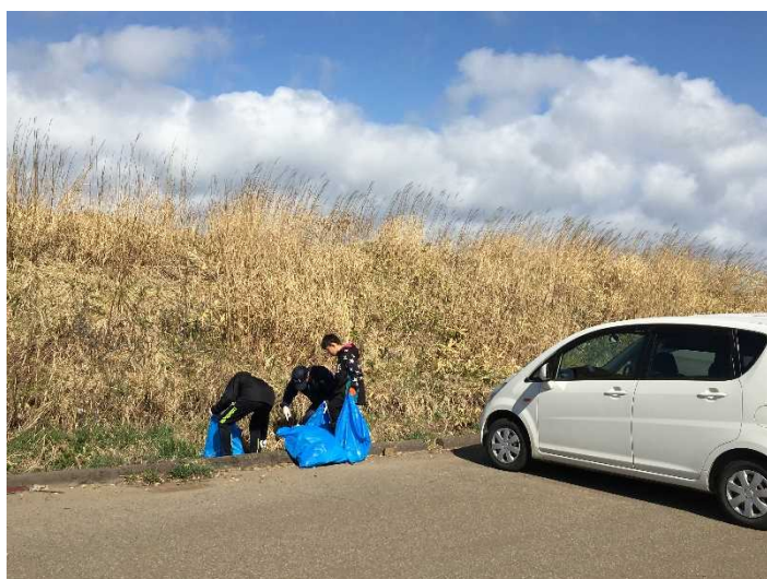
子供から大人まで約30人の地域の方々が清掃に参加しました。 (国道228号沿い榎川駐車場の清掃の様子)