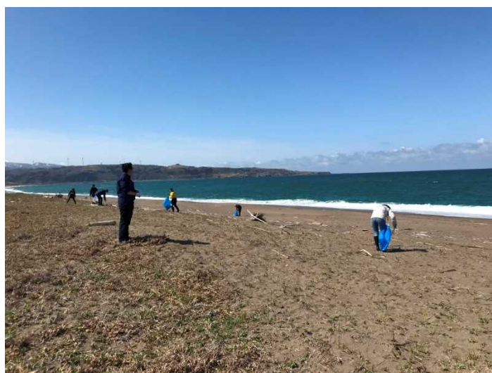
強風で吹き寄せられ散乱した漂流物を地域の方々が拾いました。 (榎川地区砂浜の清掃の様子)