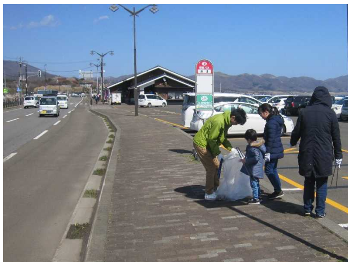
子供から大人まで約30人の地域の方々が清掃に参加しました。