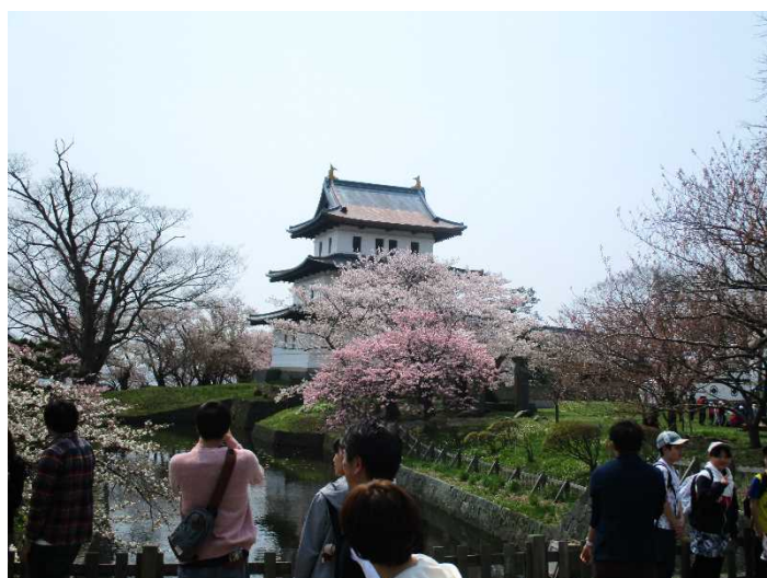
桜の時期には多くの観光客が訪れます。(昨年5月の松前公園の様子)