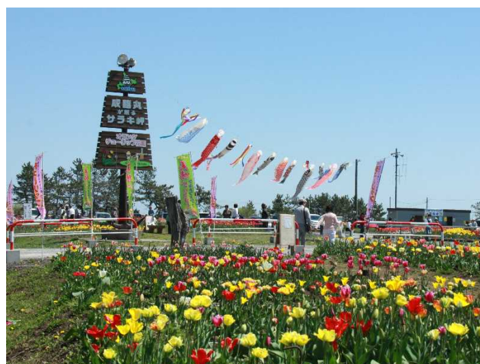
きれいになったサラキ岬では、5月頃にチューリップが満開となり、訪れる方々の心を癒します。(昨年のチューリップフェアの様子)