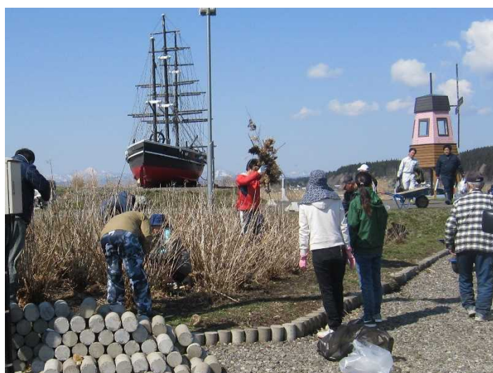
木古内町の各実施場所で約100人の地域の方々が清掃に参加しました。