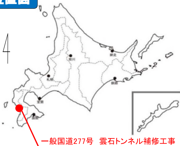
一般国道277号 雲石トンネル補修工事