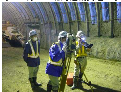
トンネル計測実習状況