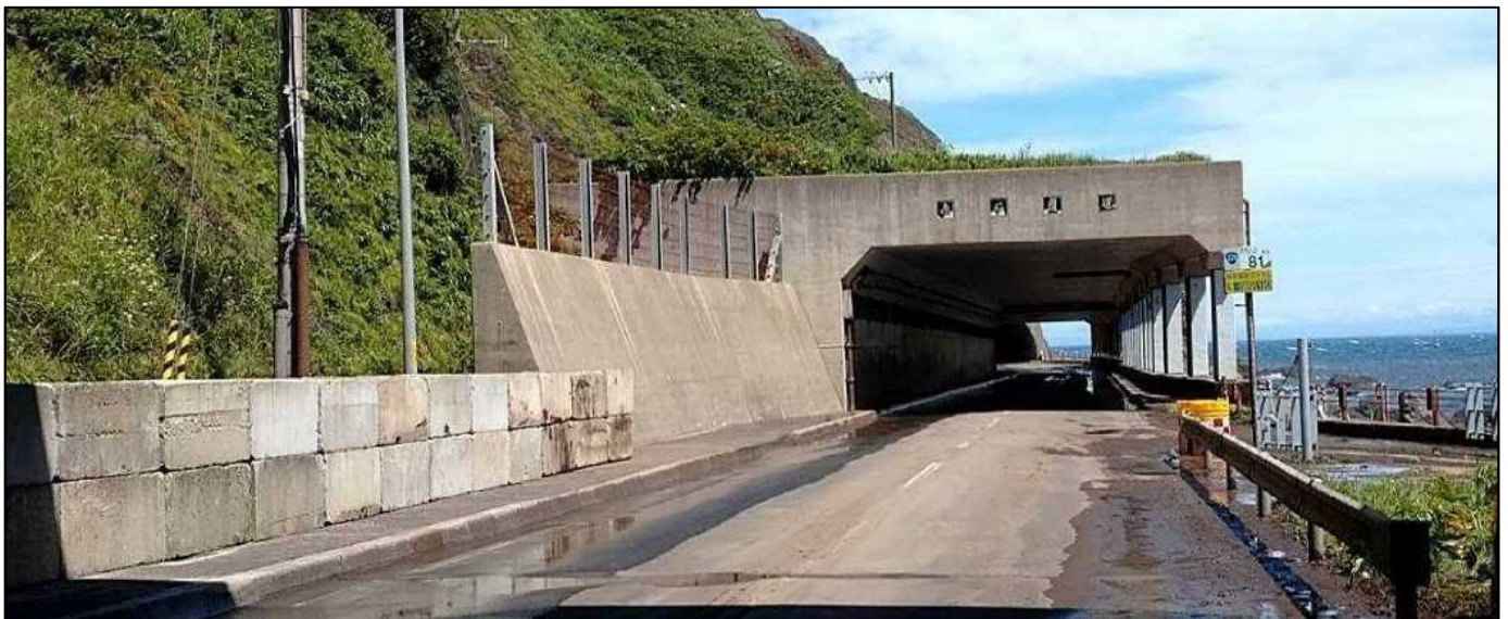
<国道228号福島町松浦の土砂撤去及びコンクリートブロック設置状況>

国道228号 福島町松浦～松前町白神 令和4年8月12日(金)14:00通行止め解除