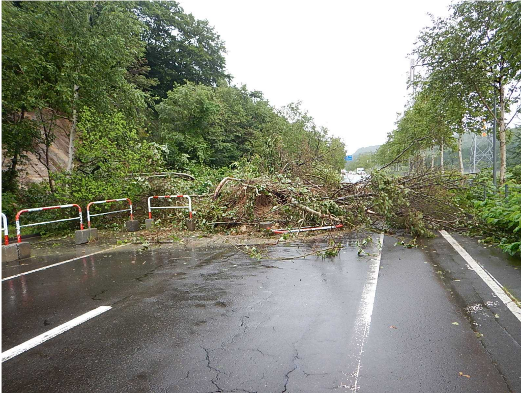
<国道230号今金町住吉の土砂流入状況>