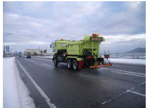
<凍結防止剤散布車>