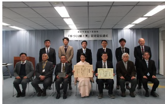
手づくり郷土賞 伝達式

活動20周年を迎えた令和5年度には、花植活動と併せて記念イベントも行い、総勢800名の方にご参加いただきました。また、『おもてなし』の気持ちを込めた活動の功績が認められ、国土交通大臣表彰「第38回手づくり郷土賞」を受賞しました。