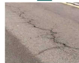
●舗装のひび割れの様子。