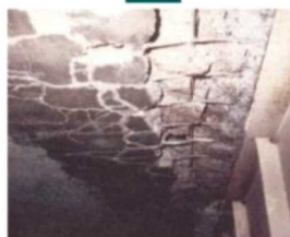
●橋が壊れている様子。