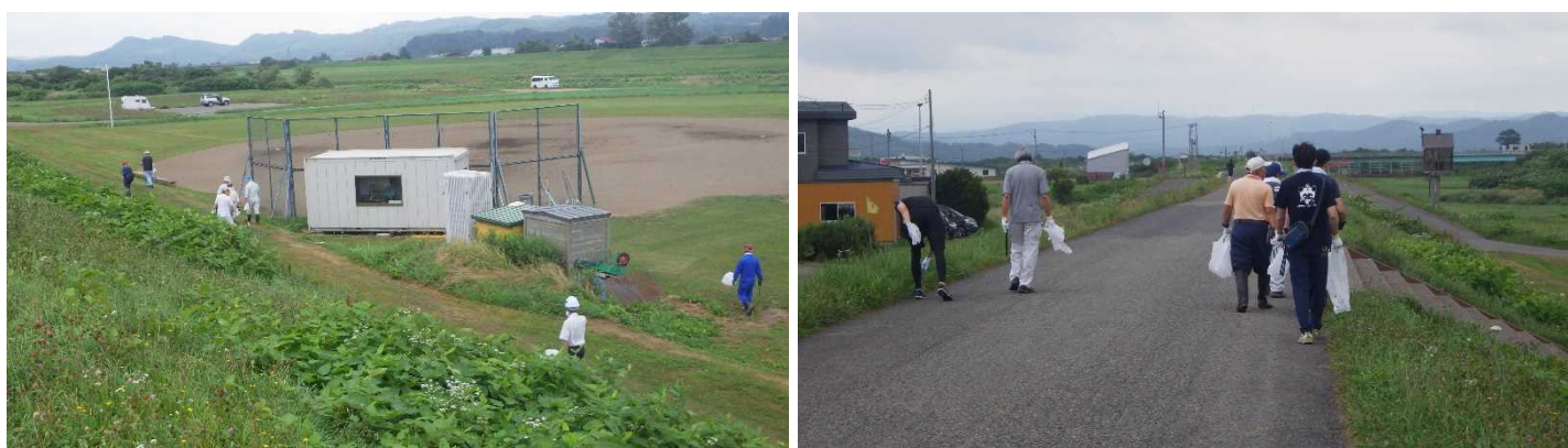
後志利別川右岸の清掃状況