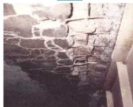
●橋が壊れている様子。