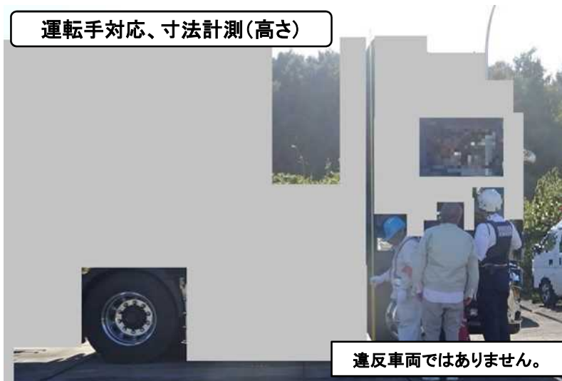
運転手対応、寸法計測(高さ)