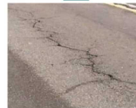
●舗装のひび割れの様子。