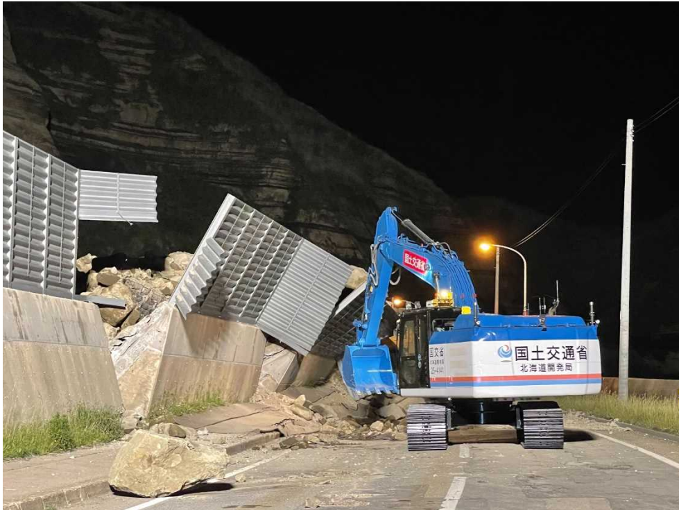
<無人バックホウによる作業状況①>