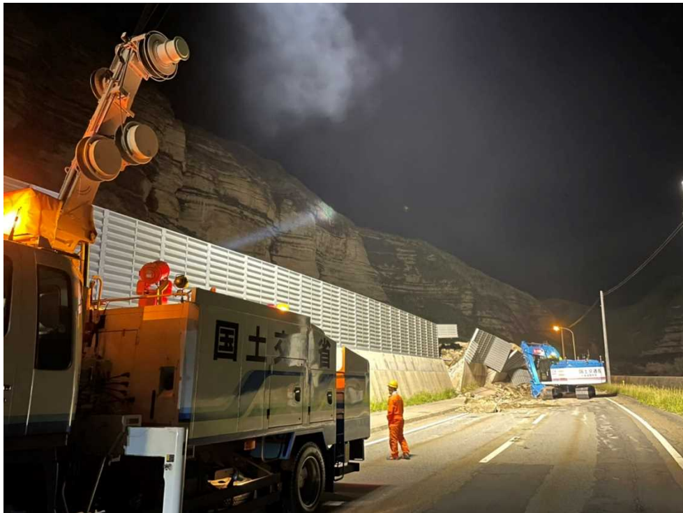
<無人バックホウによる作業状況②>