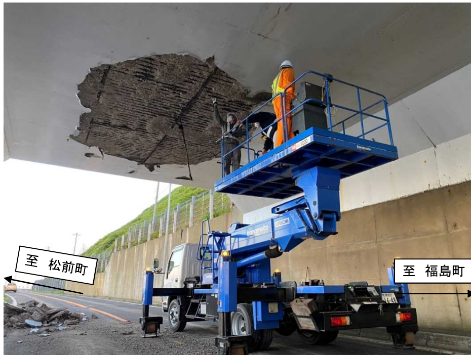
<有識者による点検状況>