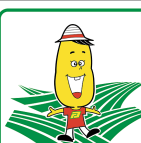
厚沢部町 Assabu Town