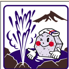
鹿部町 Shikabe Town