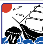
江差町 Esashi Town