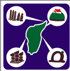
奥尻町 Okushiri Town