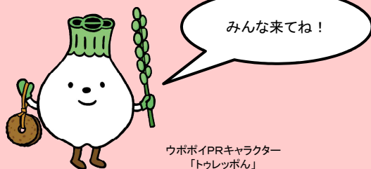
ウポポイPRキャラクター 「トウレットポン」

先住民族アイヌの過去と現在を紹介し未来へとつなぐ、アイヌを主題とした日本初の国立博物館「国立アイヌ民族博物館」。アイヌ文化を五感で経験できるフィールドミュージアム「国立民族共生公園」。ここは、自然豊かな湖畔に広がる今までにないスケールのナショナルセンターです。