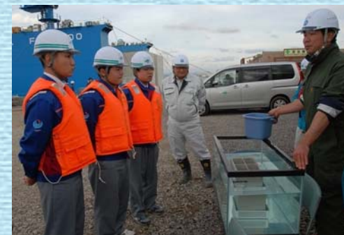
コンクリート製のケーソンが 水に浮かぶことを確認