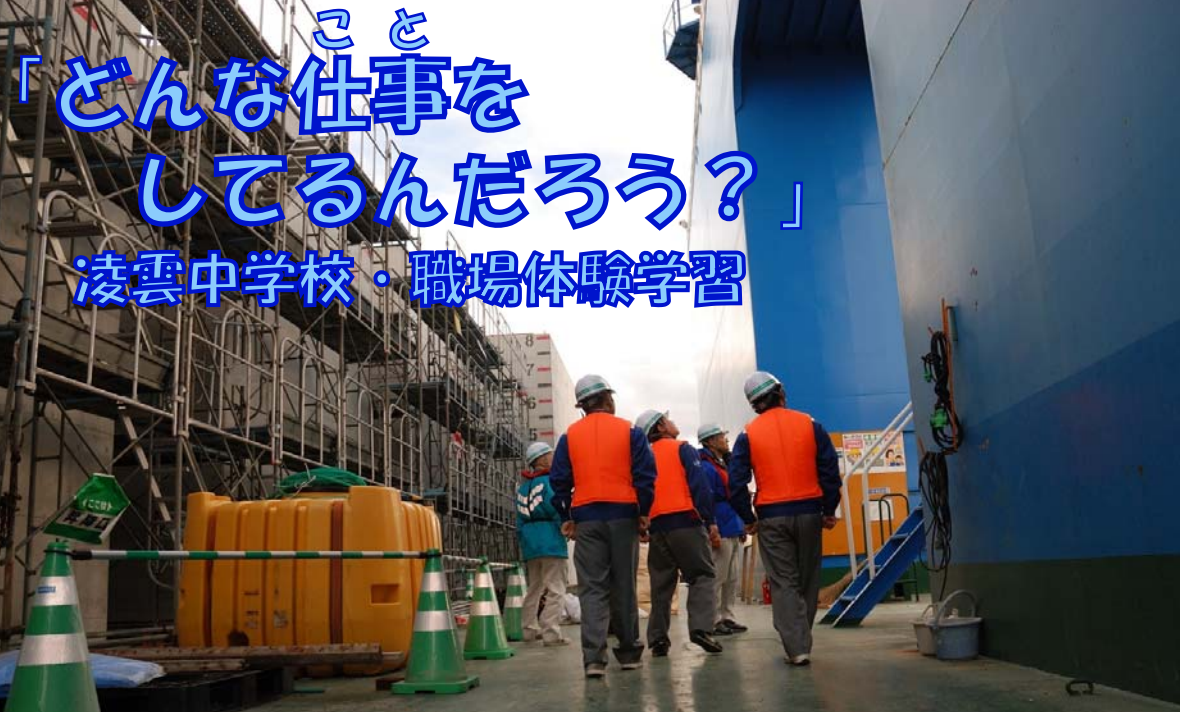
ケーソン製作用台船上を見学