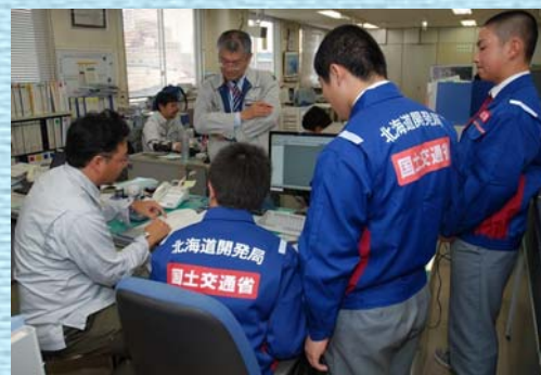
CAD製図・工事費積算体験