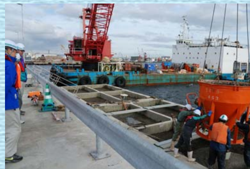
コンクリート打設の様子を見学