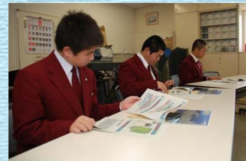
「函館港の役割」や「岸壁のつくり方」を学習