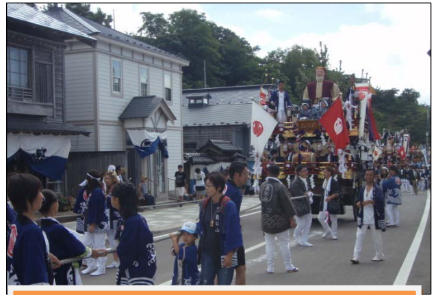
山車供奉巡行の様子(いにしえ街道)