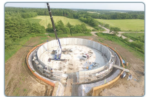
肥培かんがい配水調整池整備状況（別海北部地区）