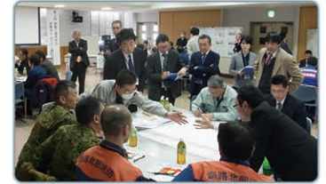
釧路川の減災に向けた取組 (標茶地区水害タイムライン検討会の様子)