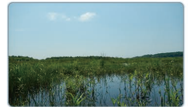
湿原の再生状況 (釧路湿原自然再生事業)