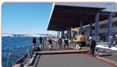
根室港花咲地区屋根付き岸壁整備状況

新たな輸出成長分野として見込まれる農水産物の輸出増加に対応し、水産物の輸出競争力強化を図るため、屋根付き岸壁の整備を進めます。