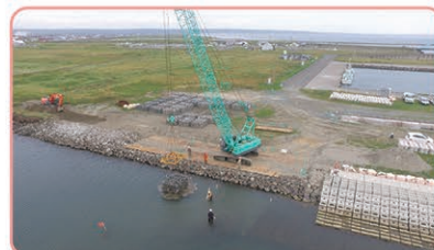
霧多布港本港地区港湾施設用地護岸整備状況