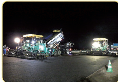
釧路空港滑走路改良状況

国内・国外航空路線網の基幹空港である釧路空港において、「観光先進国」の実現に資するよう、航空機の安全運航に必要な基本施設等の老朽化対策事業を実施します。