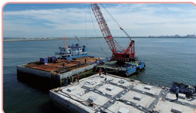
釧路港西港区新西防波堤整備状況

港内静穏度向上と漂砂の抑制を目的とした新西防波堤の整備を進めるとともに、船舶の安全な利用を確保するため、泊地の浚渫を実施します。