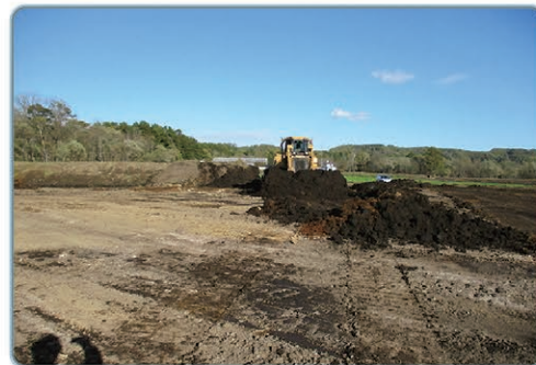
区画整理基盤整備状況(阿寒地区)