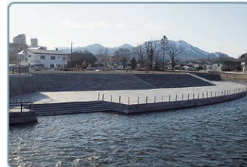
釧路川の河川改修状況(弟子屈地区)