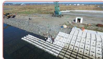
霧多布港本港地区港湾施設用地護岸整備状況

利用船舶の安全航行を確保するため、北防波堤の改良及び用地護岸の整備を実施します。