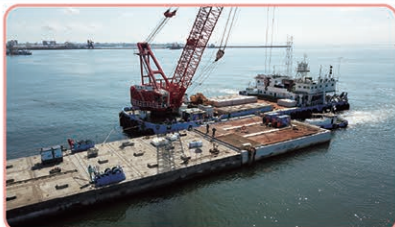
釧路港西港区新西防波堤整備状況

西港区では、港内静穏度向上と漂砂の抑制を目的とした新西防波堤の整備と船舶の円滑な利用を確保する泊地浚渫を実施します。東港区では、老朽化した西防波堤の改良を実施します。