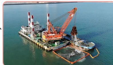
十勝港本港地区航路浚渫状況

飼料原料を運搬する大型貨物船などの船舶の安全な利用を確保するため、航路等の浚渫を実施します。