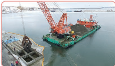
根室港花咲地区屋根付き岸壁部整備状況

花咲地区では、新たな輸成長分野として見込まれる農水産物の輸出増加に対応し、水産物の輸出競争力強化を図るため、屋根付き岸壁における岸壁部の整備を実施します。