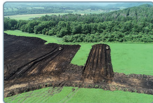
区画整理基盤整備状況(阿寒地区)