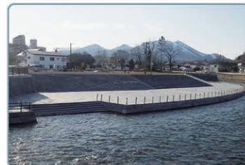
釧路川の河川改修状況