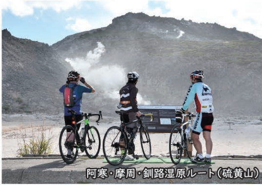
阿寒・摩周・釧路湿原ルート(硫黄山)