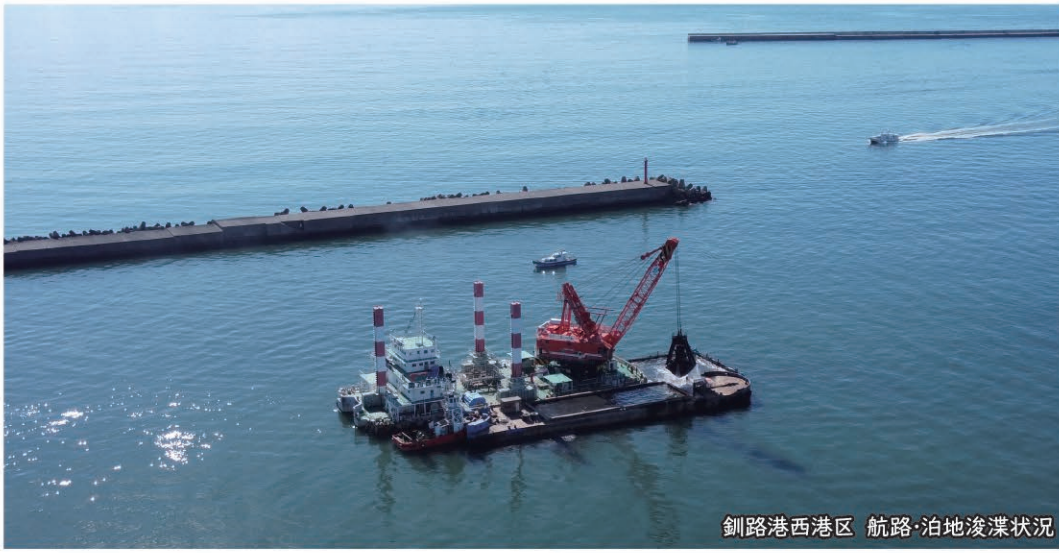
釧路港西港区 航路・泊地浚渫状況