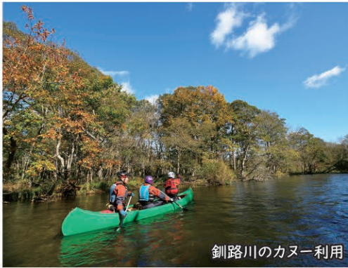
釧路川のカヌー利用