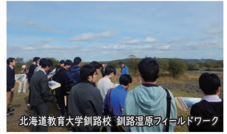
北海道教育大学釧路校 釧路湿原フィールドワーク