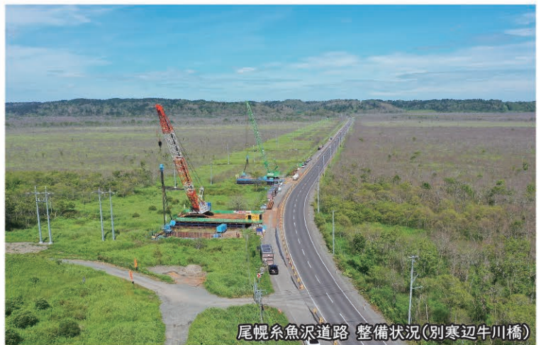
尾幌糸魚沢道路 整備状況(別寒辺牛川橋)