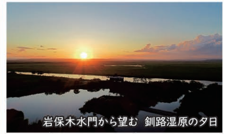
岩保木水門から望む 釧路湿原の夕日