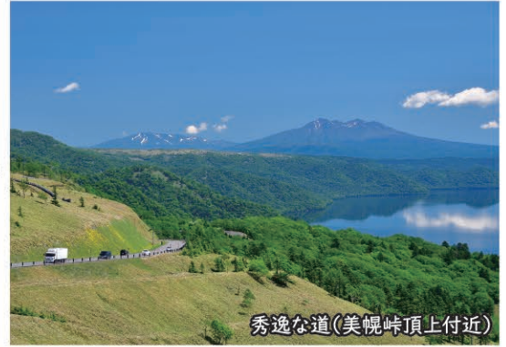
秀逸な道(美幌峠頂上付近)