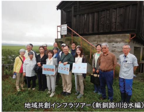
地域共創インフラツアー(新釧路川治水編)