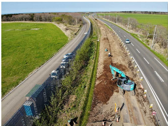
【施工状況(湖南地区)】