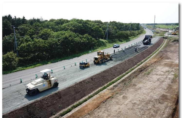
【施工状況(川口地区)】