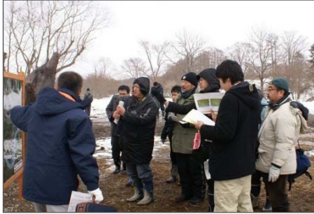
釧路湿原の自然再生について 現地を赴いて説明 【釧路湿原見学会】