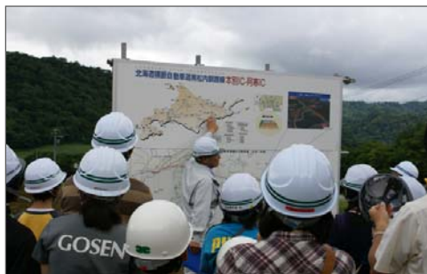
白糖IC(仮称)で建設計画の説明

7月31日、小中学生と保護者を参加対象とした、建設中の北海道横断自動車道(横断道)の現場見学会を開催、多くの方々にご参加いただきました。