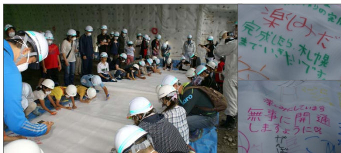
トンネルの防水シートに記念の寄せ書き