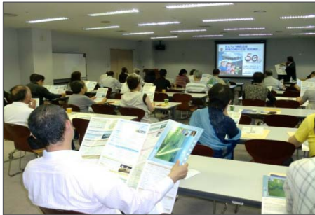
釧路空港について講演 【釧路空港について】