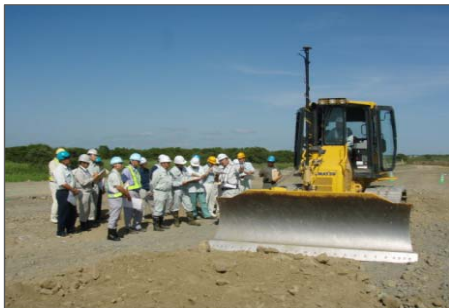
衛星通信による建設機械の操作 を実演により説明 【情報化施工の推進について】