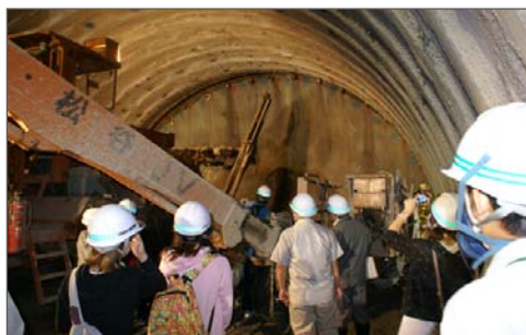
トンネルを掘り進める機械を見学

普段は入ることが出来ない工事中のトンネルの中を歩き、重機の試運転等を見学、トンネル建設に使う資材に記念の寄せ書きをしていただきました。