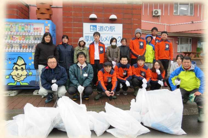
H29.10.17 厚岸グルメパーク