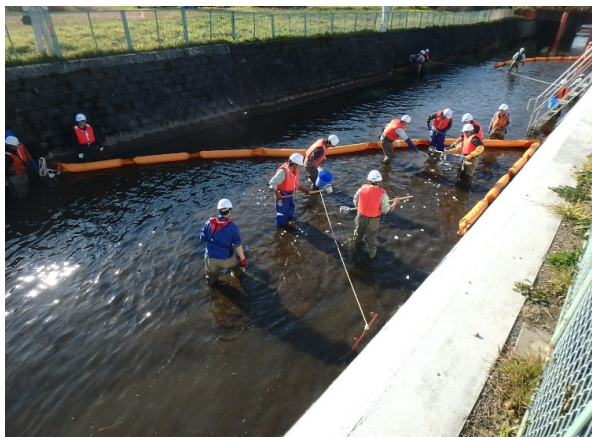
油流出拡散防止訓練（オイルフェンス設置）