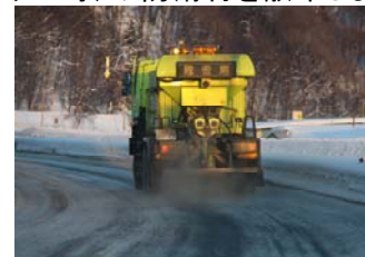
〈凍結防止剤散布車〉

凍結防止剤散布車で坂道や交差点部などで発生したツルツル路面へ凍結防止剤(塩化ナトリウム等)や防滑材を散布します。