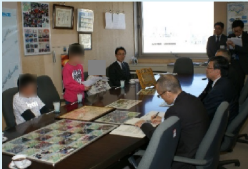
釧路開発建設部で児童から植樹活動の様子を報告（5 月 9 日）

また、5 月 9 日には遠矢小学校の学校関係者や児童の代表が釧路開発建設部を訪問し受賞の報告を、15 日には全校集会で児童のみなさんに改めて受賞の報告を行い喜びを分かち合いました。