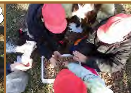
タネは均一にまきます