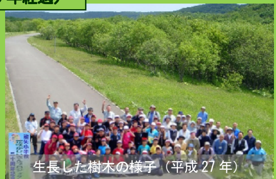
生長した樹木の様子 (平成 27 年)