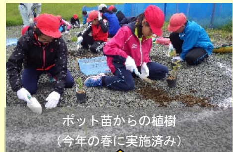
ポット苗からの植樹 (今年の春に実施済み)