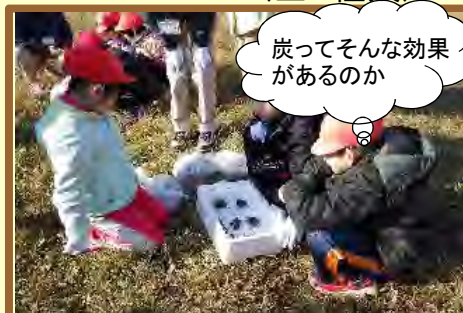
保水効果の炭をいれます

○種 類：ヤチダモ、エゾヤマハギ、ツリバナ、エゾヤマザクラ、シウリザクラ、ホオノキ （全6種類）