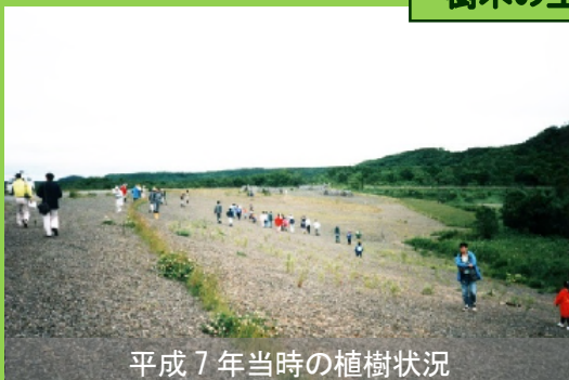
平成 7 年当時の植樹状況