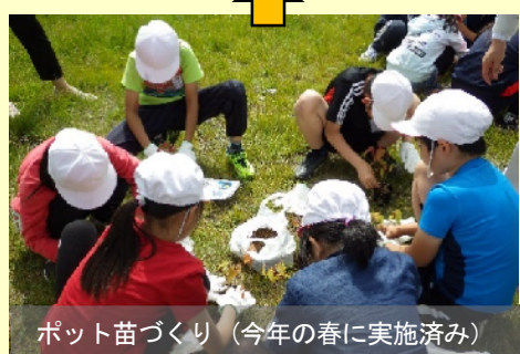
ポット苗づくり (今年の春に実施済み)