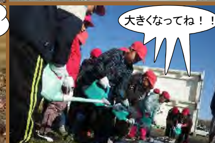
最後にたっぷりの水をあげます