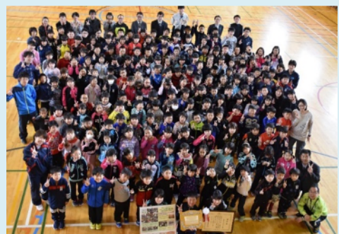
遠矢小学校にて児童全体で受賞後の記念撮影（5 月 15 日）