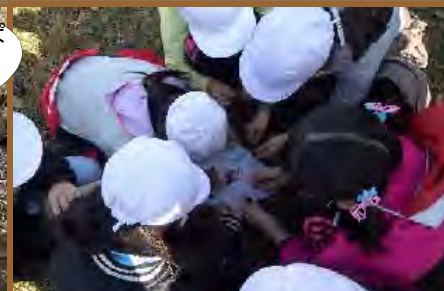
採取したタネは観察し選別します