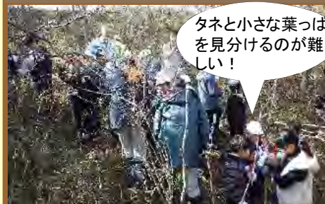
タネ採取の様子(エゾヤマハギ)