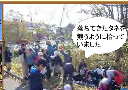
タネ採取の様子(ヤチダモ)