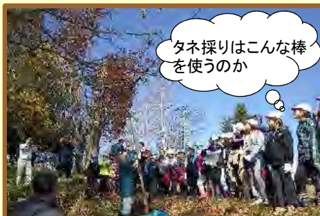
樹木とタネ採り方法についての説明