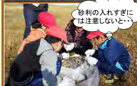
乾燥・雑草防止のため砂利で保護