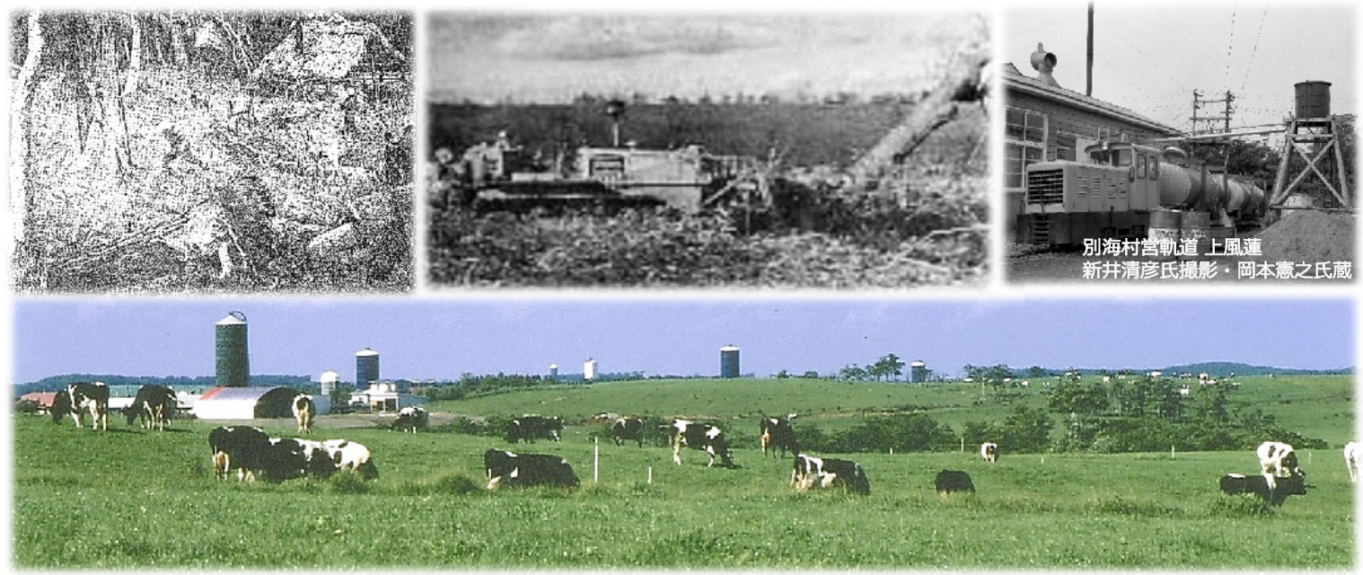
別海村宮軌道 上風道