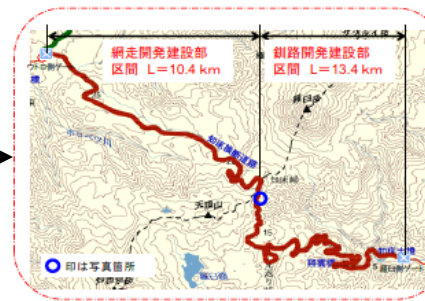
知床峠の除雪状況について(4月14日 10時・15時現在の状況)