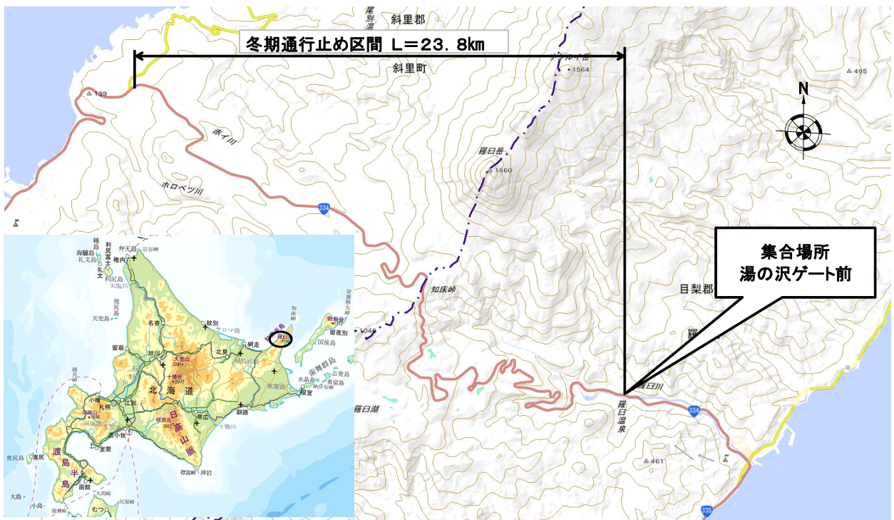
集合場所図（国道334号と国道335号の交点から知床峠方向へ約3.5km地点）