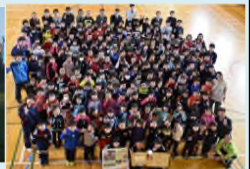
遠矢小学校にて児童全体で受賞後の記念撮影