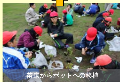
苗床からポットへの移植