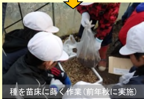
種を苗床に蒔く作業（前年秋に実施）