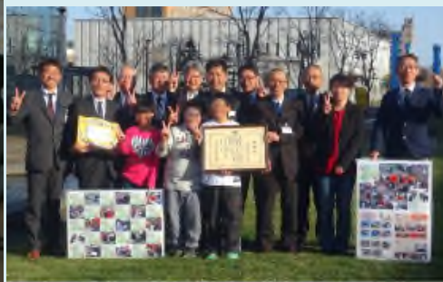
釧路開発建設部での記念撮影