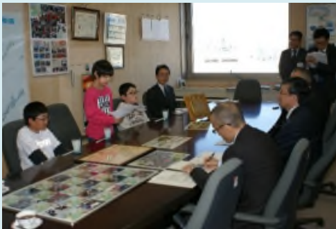
釧路開発建設部で児童から植樹活動の様子を報告

また、平成29年5月9日には遠矢小学校の学校関係者や児童の代表が釧路開発建設部を訪問し受賞の報告を、15日には全校集会で児童のみなさんに改めて受賞の報告を行い喜びを分かち合いました。