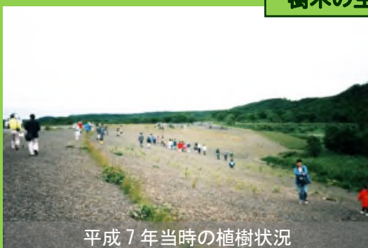
平成7年当時の植樹状況