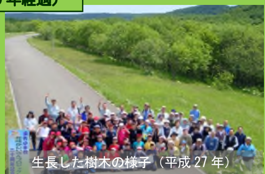
生長した樹木の様子（平成27年）