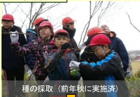
種の採取（前年秋に実施済）