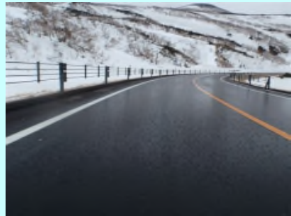
ブラックアイスパーンの状況