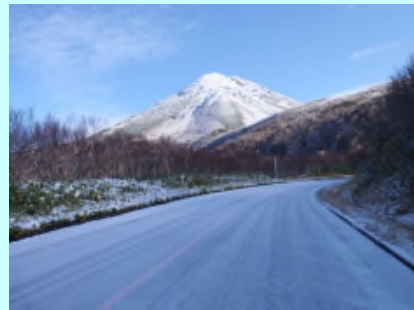
積雪時の状況(初冬)