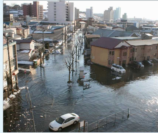
東日本大震災（2011.3.11） 釧路川左岸地域が浸水（大町、入舟、知人町の一帯） （釧路市道東経済センタービルより撮影）

忘れていませんか？ 十勝沖地震（1952）から69年 釧路沖地震（1993）から28年 東日本大震災（2011）から10年