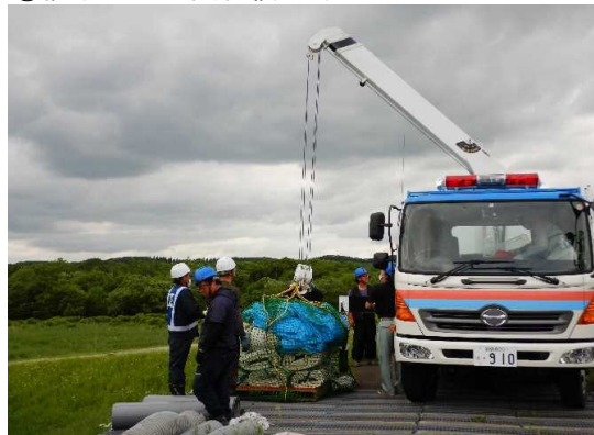
②排水ポンプ資材積み卸し