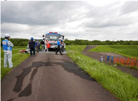
①排水ポンプ車現地到着