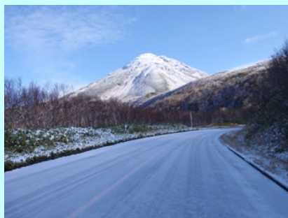
積雪時の状況(初冬)