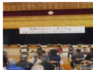
シンポジウムの開催