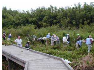
ビオトープの整備