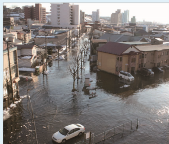
東日本大震災（2011.3.11） 釧路川左岸地域が浸水（天町、入舟、知人町の一部） （釧路市道東経済センタービルより撮影）

忘れていませんか？ 十勝沖地震（1952）から70年 釧路沖地震（1993）から29年 東日本大震災（2011）から11年