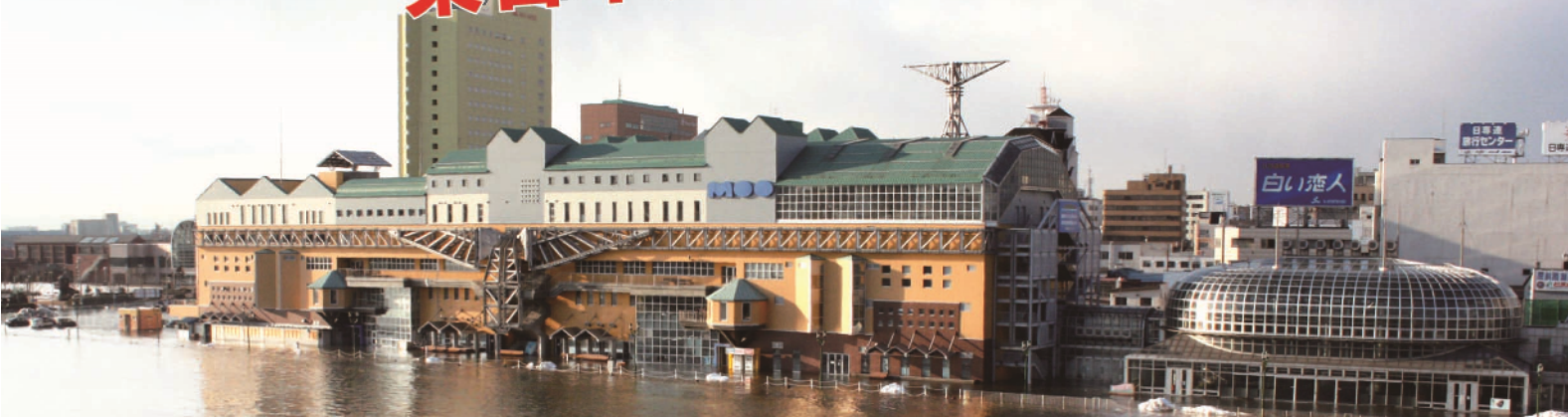
東日本大震災（2011.3.11） 釧路市にも2mを超える津波が襲来

忘れていませんか？ 十勝沖地震（1952）から70年 釧路沖地震（1993）から29年 東日本大震災（2011）から11年