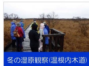
冬の湿原観察(温根内木道)