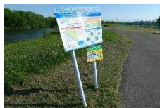
看板が傾いていました

日常生活やお出かけなどの際に釧路川・釧路湿原の状況を観察し、お気づきのことがあれば、その内容を川レンジャー事務局へ連絡していただくことが主な活動内容です。