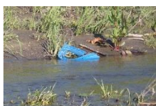
川にゴミがありました