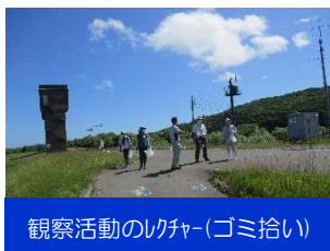
観察活動のレクチャー(ゴミ拾い)

釧路湿原や河川環境などについて、より理解を深めるための学習会や体験活動を年4回程度開催いたします。