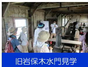
旧岩保木水門見学