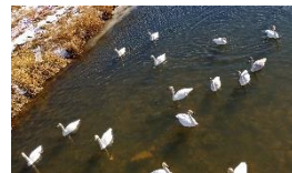
川に白鳥が 来ていました