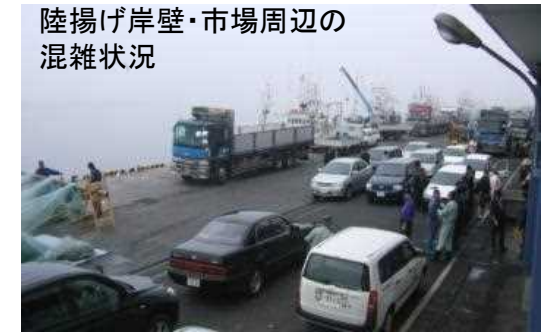
陸揚げ岸壁・市場周辺の混雑状況