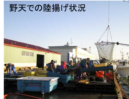
野天での陸揚げ状況