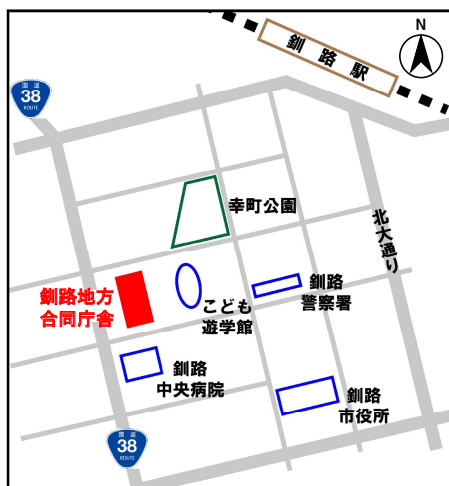
集合場所：釧路地方合同庁舎 (釧路市幸町 10 丁目 3 番地)