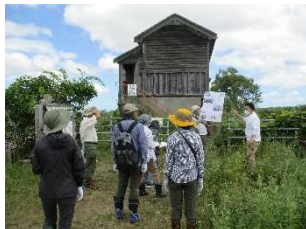
旧岩保木水門見学

体験活動や現地見学等をとおり、釧路湿原や河川環境などについてより理解を深めるための学習会を、年4回程度開催いたします。