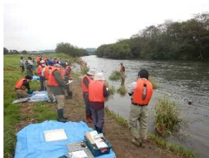
釧路川の水質調査