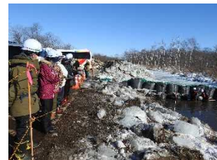
又マオロ地区自然再生事業地 工事現場見学