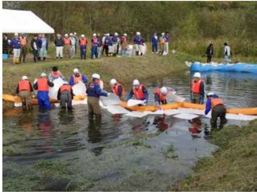
オイルフェンス等の設置