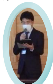
□ 標茶町 □