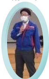
□ 開発局 □