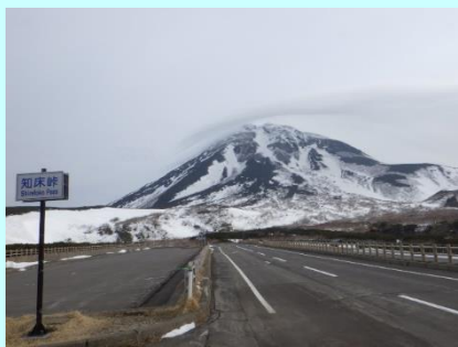
路面乾燥の状況 (10月下旬)