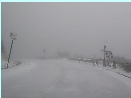
路面凍結の状況 (11月上旬)