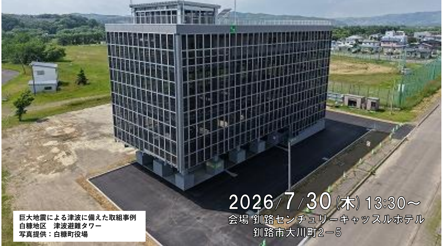
巨大地震による津波に備えた取組事例 白糠地区 津波避難タワー

2026/7/30 (木) 13:30～ 会場 釧路センチュリーキャッスルホテル 釧路市大川町2-5