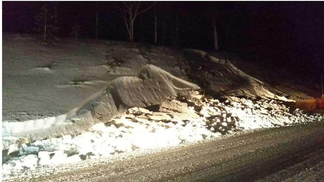
雪崩発生箇所法面状況