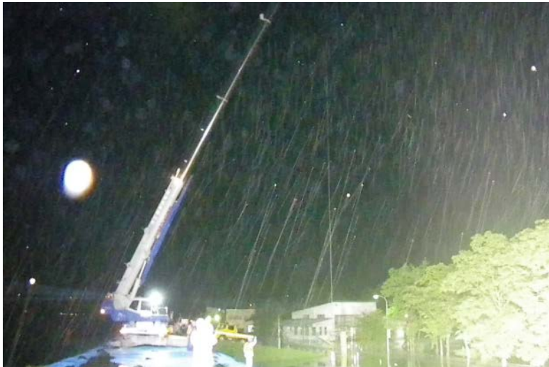
大型土のう設置作業状況