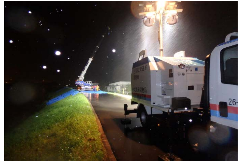
夜間照明の状況