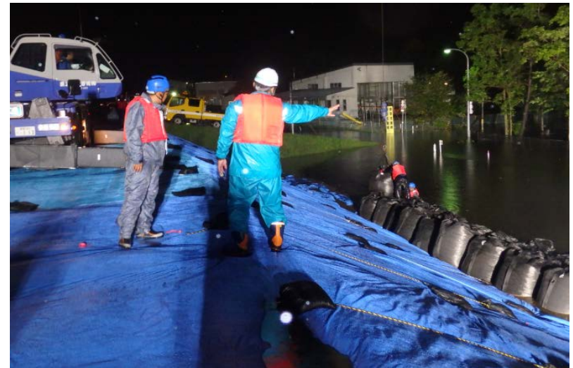
大型土のう設置作業状況