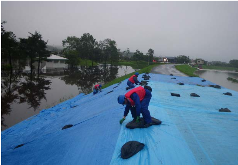
シート張り作業状況